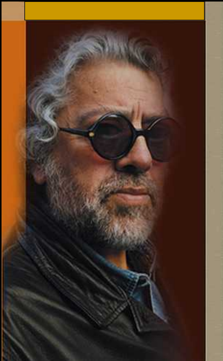
FACUNDO CABRAL - ARGENTINA